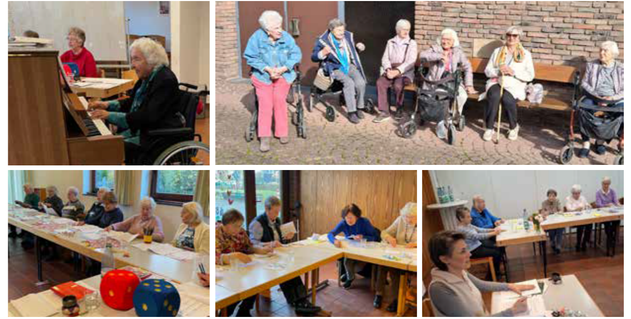
© Seniorentreff: Langhans; Gedächtnistraining Königsdorf: Langhans; Gedächtnistraining Brauweiler: Segatz

Seniorenachmittag: Singstunde mit Frau Linkenbach ( links ); Gedächtnistraining ( rechts unten )