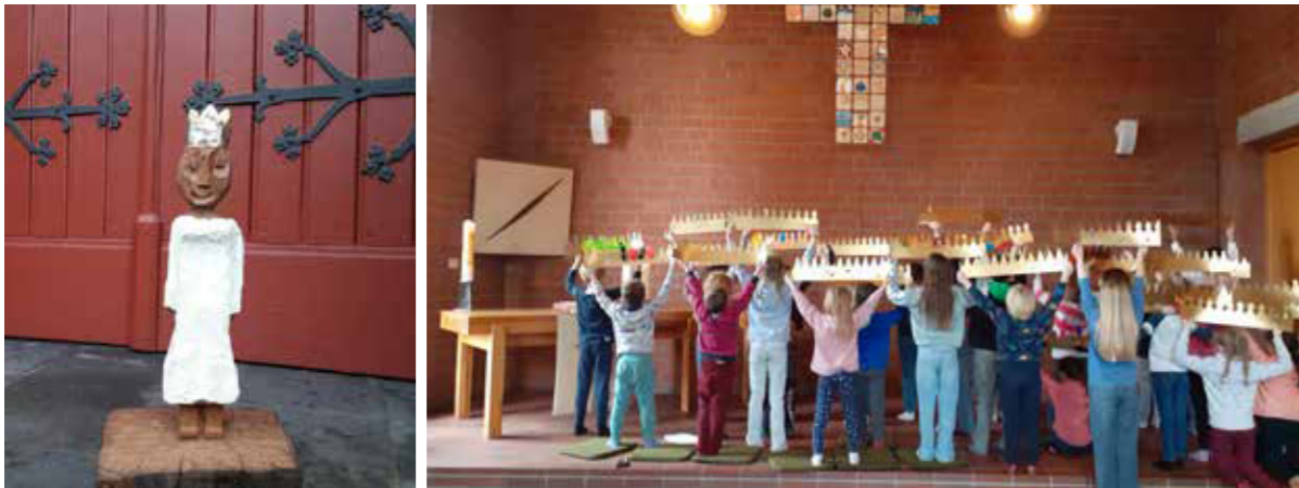
© Ökumenischer Neujahrsgottesdienst: Bertenrath; Sternsinger: Sasse

Ökumenischer Neujahrsgottesdienst ( links ); Sternsinger ( rechts )