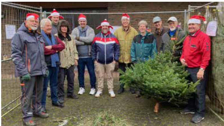
Ä Tännsche